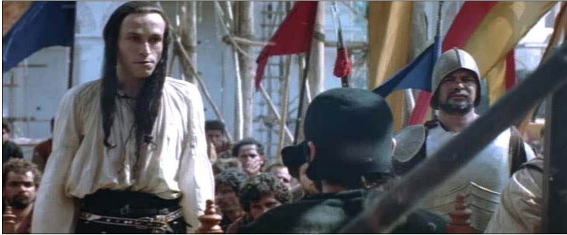
약식 재판정에서 분노를 표출하는 스페인 귀족 모히카(미카엘 윈코트 분)

가들이 해석한 몽상가로서의 콜럼버스의 이미지를 차용한 탓이다 (Ayala & Lipsett-Rivera 1997).