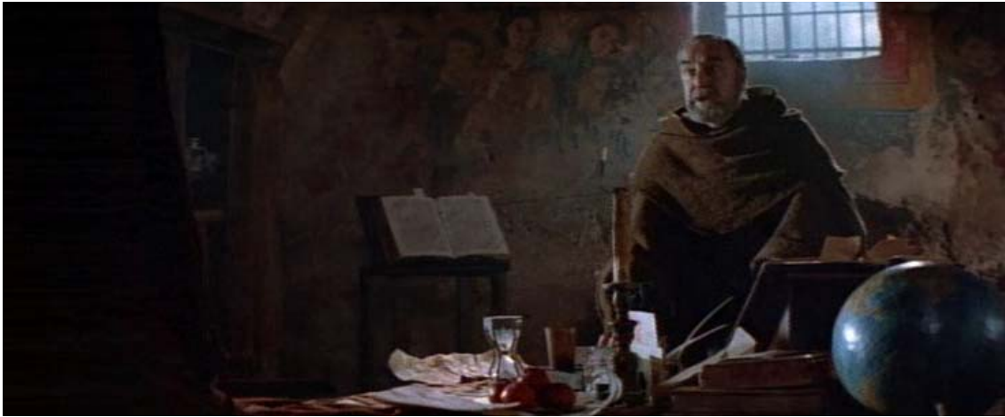
영화 <1492, 낙원의 정복>의 한 장면. 오른쪽 하단의 지구본은 시대착오적인 소품이다.

당대의 사고를 무너뜨린 사람이었다라고 말하는 그릇된 상식. 이는 콜럼버스 신화의 주된 레퍼토리다. 일찍이 그리스의 과학저술가 · 천문학자 에라토스테네스가 구체로서의 지구 가설에 근거해 지구의 둘레를 거의 실제거리에 가깝도록 계산해 낸 역사적 성취를 뒤로 함은 물론이다. 19세기 미국에서는 콜럼버스를 영웅적이고, 이성적이며, 근대적이기까지 한 건국의 아버지로 떠받들었다. 미국 작가 워싱턴 어빙은 『크리스토퍼 콜럼버스의 생애와 항해』(1828)에서 콜럼버스가 항해에 나서기 앞서 1486년 살라만카 대학에서 학자, 성직자들과 더불어 지구가 평평한지를 놓고 한바탕 논쟁을 벌였다고 묘사했다. 1) 이러한 해석은 100년이 넘게 위세를 떨치며 오늘날의 대중적인 콜럼버스의 이미지를 형성하는 데 크나큰 영향을 미치게 됐다. 1940년대가 되어서야 콜럼버스 영웅 만들기가 퇴조하고 ‘신대륙 발견’ 500주년을 즈음하면서는 콜럼버스에 관한 다양한 시각이 표출되면서 이윽고 그를 둘러싼 종합적 그림이 완성되어 가기에 이르렀다.